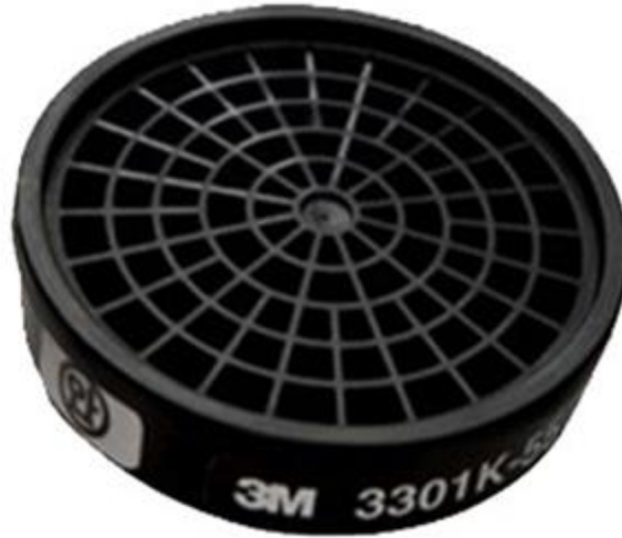
Phin lọc hơi hữu cơ 3M 3301K-55

Mặt nạ nửa mặt dòng 3M 3200 được sử dụng kèm với các loại tấm lọc và nắp giữ, giúp bảo vệ hô hấp người lao động trong môi trường làm việc có bụi hàn, khói hàn, hơi hữu cơ dùng nhiều trong quá trình hàn cắt, chế tác kim loại, gỗ...Loại mặt nạ nửa mặt dòng 3200 thường được sử dụng kết hợp với các phin lọc 3M 3301K-100, phin lọc 3M 3301K-55, tấm lọc 3M 3744K