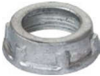
Hợp kim nhôm DN/BDN

Vật liệu (Material): Antimon (Zinc die cast), Nhựa PP (Polypropylene), Hợp kim nhôm (Aluminum alloy)