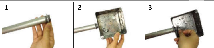
Lắp tân ren trong

Hướng dẫn sử dụng TÂN REN TRONG và ĐAI NỐI