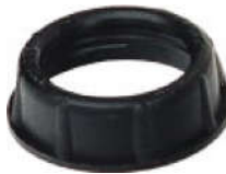
Nhựa PP ADN(P)