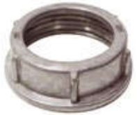
Hợp kim nhôm ADN