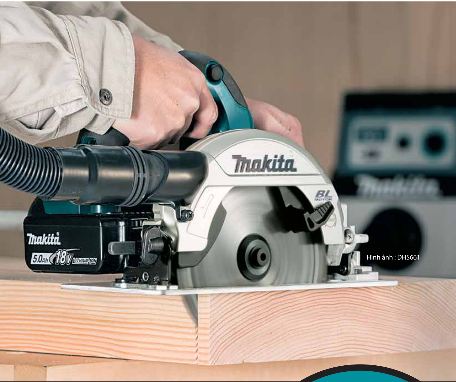
Hình ảnh : DHS661