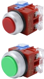
자동복귀방식 Automatic reset

※접점 추가시 따로 표기되지 않습니다.(예: HC25B-2 주문시에도 제품 내 프린트는 HC25B-1로 표기됨)