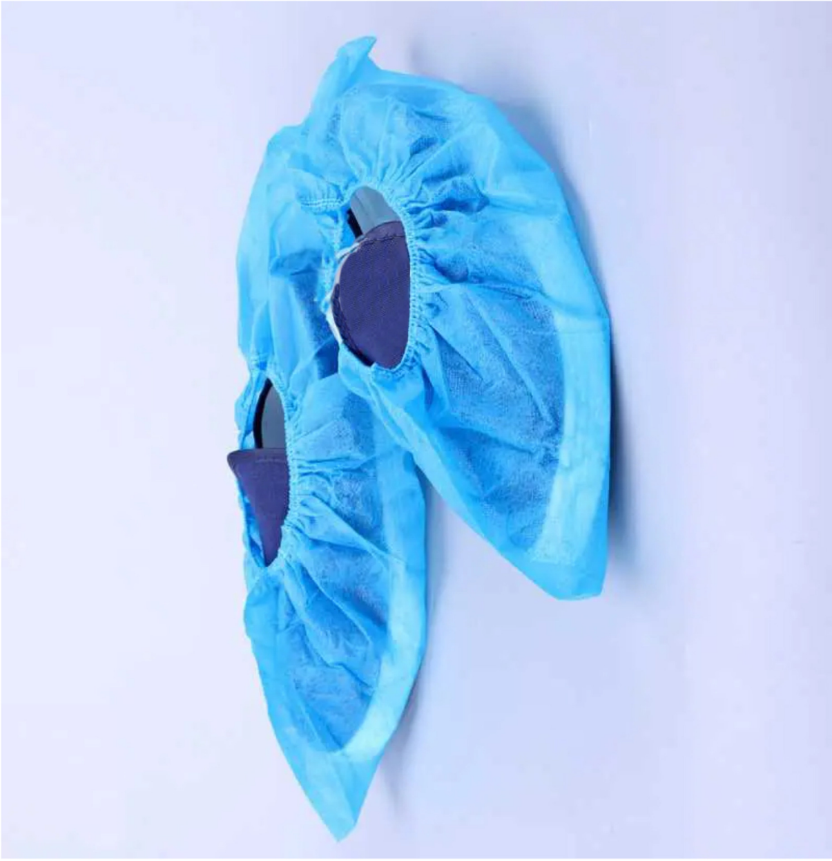
Bọc giày vải không dệt bao trùm kín đôi giày của công nhân

Bao giày vải không dệt là một vật dụng để bao bọc trùm bên ngoài đôi giày , hoặc đôi chân người dùng để ngăn ngừa bụi bẩn, vi khuẩn từ môi trường ngoài vào trong môi trường phòng sạch.