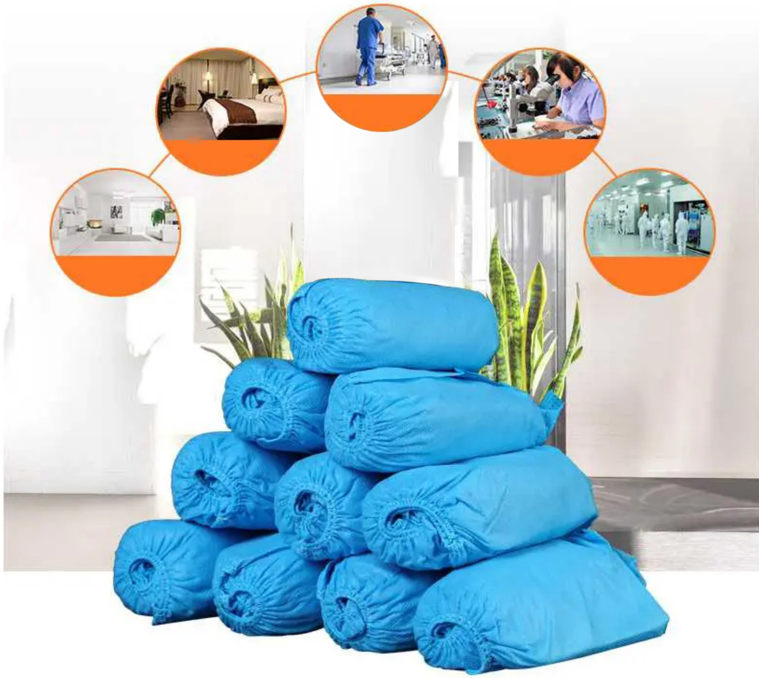
Các ứng dụng khác: Y tế, chế biến thực phẩm, phòng nghiên cứu, nội thất