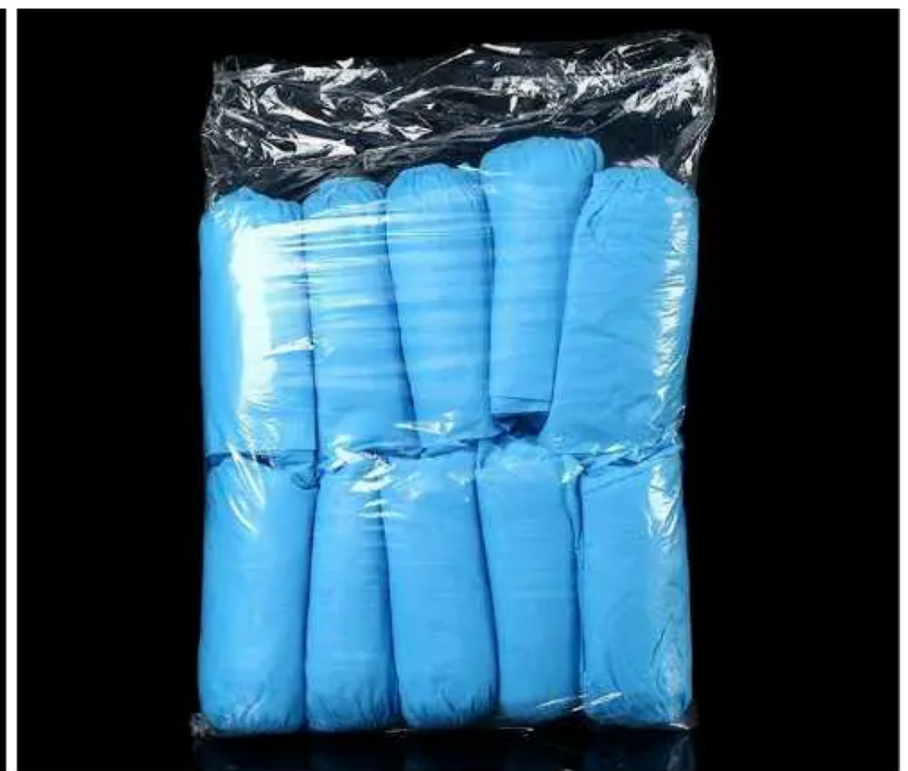
Đễ dàng chia cho các line hoặc các bộ phận cho công nhân sử dụng