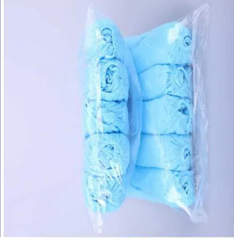
Bao giấy được cuộn tròn thành từng cuộn nhỏ: 1 bịch = 10 cuộn, 1 cuộn = 10 cái (5 đôi)